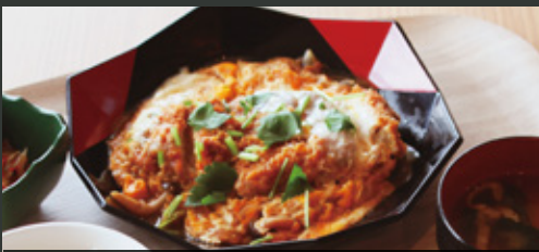
レンブラント特製 カツ煮定食 ¥1,000