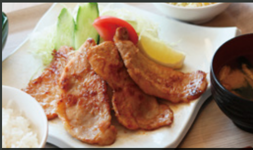
名物 レンブラン豚 富士盛り定食 ¥1,000