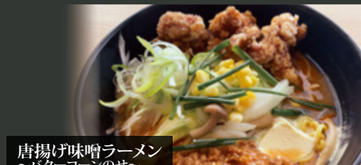
唐揚げ味噌ラーメン ~バターコーンのせ~ ¥1,000