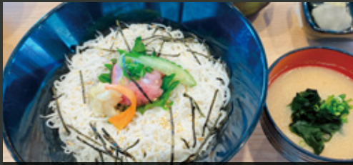
レンブラント特製 釜揚げしらすネギトロ丼定食 ¥1,000