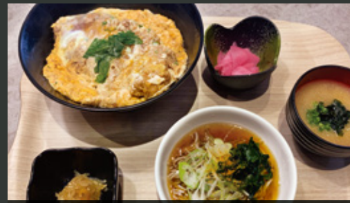
かつ丼&ミニそばセット ¥1,200