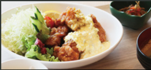
若鶏南蛮 特製タルタル定食 ¥1,000