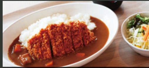
レンブラント特製 極 トンカツカレー ¥1,000