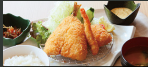
Mixフライ 特製タルタル定食 ¥1,000