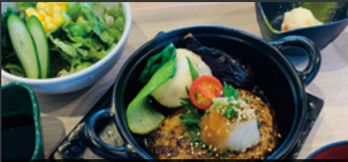
和風おろしハンバーグ ¥1,000