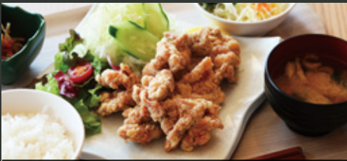
若鶏から揚げ定食 ¥800