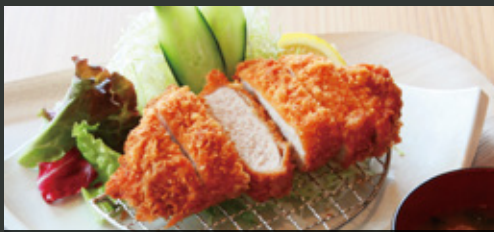
名物 レンブラント特製 極 トンカツ定食 ¥1,000