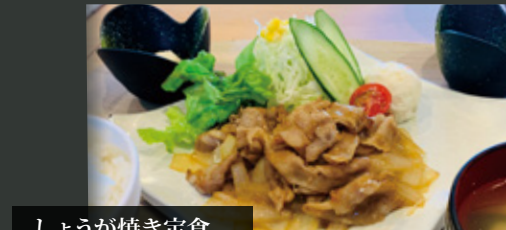
しょうが焼き定食 ¥900