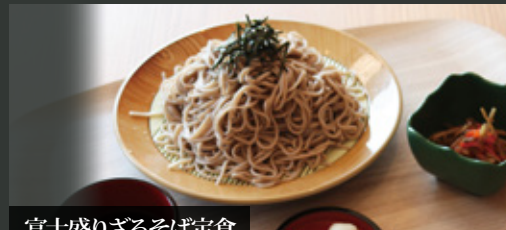
富士盛りざるそば定食 ¥600