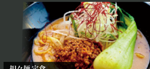
担々麺 定食 ¥800