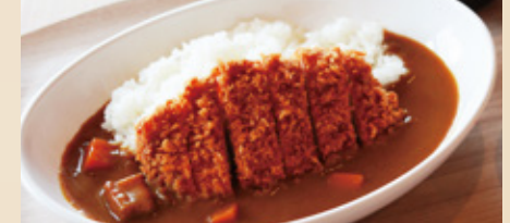
極 カツカレー ¥1,100円(税込)