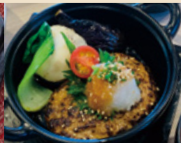
和風おろしハンバーグ定食 ¥1,000円(税込)