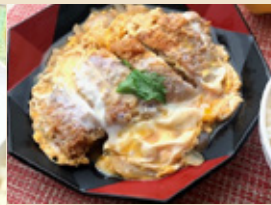
極 カツ煮定食 ¥1,100円(税込)