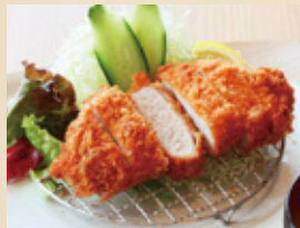
極 トンカツ定食 ¥1,100円(税込)