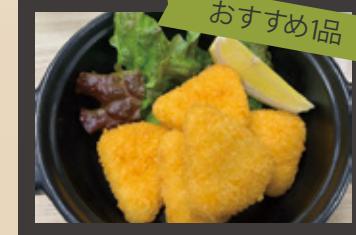
おすすめ品 カマンベールチーズフライ ¥500円(税込)