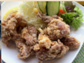
からあげ定食 ¥800円(税込)