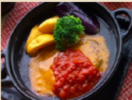
チーズハンバーグ定食 ¥1,100円(税込)