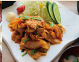
豚キムチ定食 ¥900円(税込)