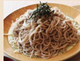
富士盛りざるそば ¥700円(税込)