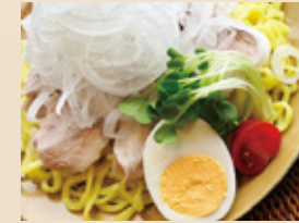
和風冷しゃぶ ざるラーメン ¥900円(税込)