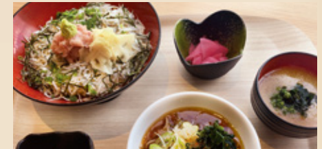
釜揚げしらすネギトロ丼 &ミニそばセット ¥1,200円(税込)