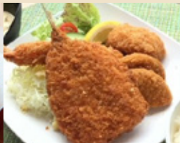
MIXフライ定食 ¥1,100円(税込)