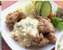
若鶏南蛮定食 ¥1,000円(税込)