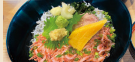
桜えびの三色丼 ¥1,300円(税込)