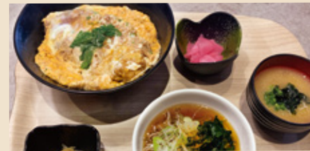
カツ丼 &ミニそばセット ¥1,200円(税込)