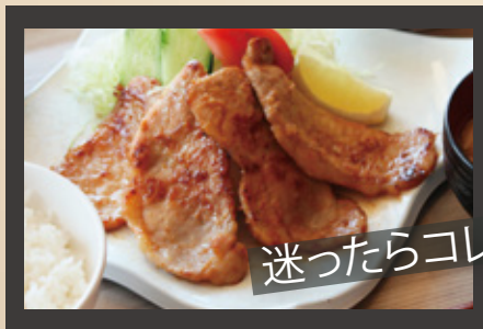
レンブラント豚 富士盛り定食 ¥1,100円(税込)